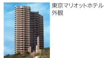
東京マリオットホテル 外観