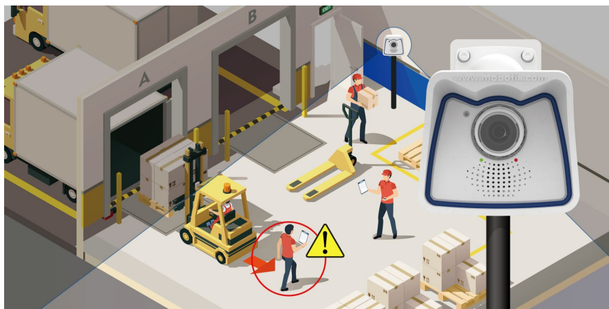
画像IoTを活用したフォークリフト事故低減サービスのイメージ